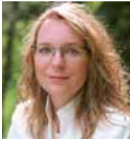
Prof. Dr. Claudia Kemfert

Abteilungsleiterin Energie, Verkehr, Umwelt; Inhaberin des Lehrstuhls Umweltökonomie, Humboldt-Universität Berlin Deutsches Institut für Wirtschaftsforschung Berlin, Mohrenstraße 58 10117 Berlin