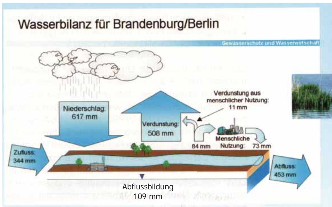
Bild: Wasserbilanz (für die politischen Räume) Brandenburg und Berlin; Stand 2000; (Quelle: Landesumweltamt Brandenburg)

D. h. Brandenburg (und Berlin) zeichnen sich naturbedingt durch ein geringes potenzielles Dargebot („Eigenwasserdargebot“) aus und sind stark von Fremdzufüssen aus angrenzenden Regionen abhängig. Das Bundesland Brandenburg gilt zwar allgemein als „gewässerreiches Land“, das aber „an sich“ als „wasserarm“ eingestuft werden muss. In vielen Regionen des Landes ist der Wasser- und Stoffhaushalt seit Jahrhunderten nachhaltig beeinträchtigt, was seinen Niederschlag auch darin findet, dass ein großer Teil der Brandenburgischen Oberflächengewässer bis 2015 die Auflagen der EG – WRRL nach einem guten ökologischen Zustand bzw. Potenzial nicht erfüllen wird. Diese Problematik kommt auch in den „wichtigsten Wasserbewirtschaftungsfragen“ zum Ausdruck, die gemäß EG-WRRL am 22. Dezember 2007 für die Anhörung in der Öffentlichkeit zu benennen waren. Im Gegensatz zum allgemeinen (Landes-)Politikverständnis orientiert die EG-WRRL nicht an politisch-administrativen Grenzen, sondern an den Einzugsgebieten der großen europäischen Flüsse, den sogenannten „Flussgebietseinheiten“. Brandenburg gehört zu den beiden internationalen Flussgebietseinheiten Elbe und Oder. Die Flussgebietsgemeinschaft (FGG) Elbe arbeitete neben einer Vielzahl von Defiziten,