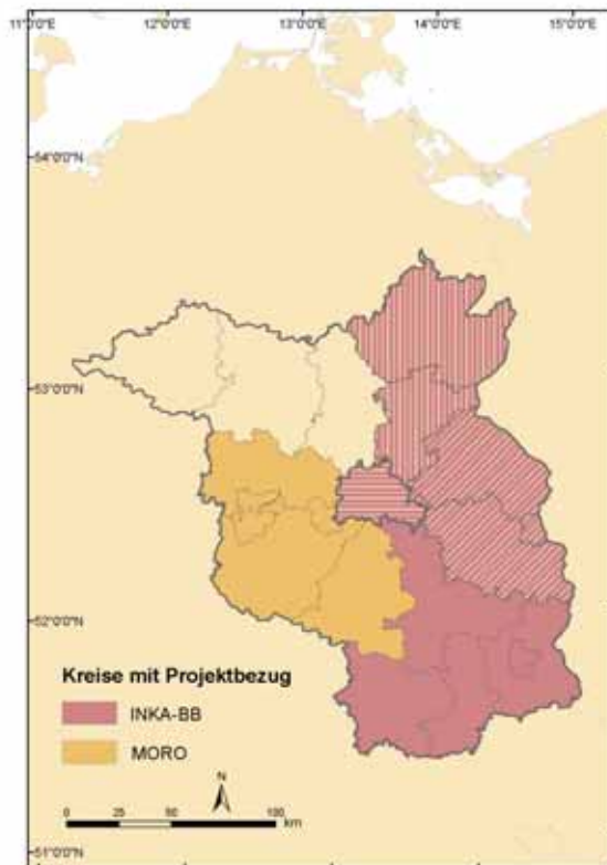
Bild: Regionale Verteilung von Aktivitäten zur Erforschung von Anpassungsmaßnahmen an den Klimawandel in den 2009 beginnenden Projektverbänden INKA-BB und MORO Havelland-Fläming (siehe Beschreibung auf Seite 23)